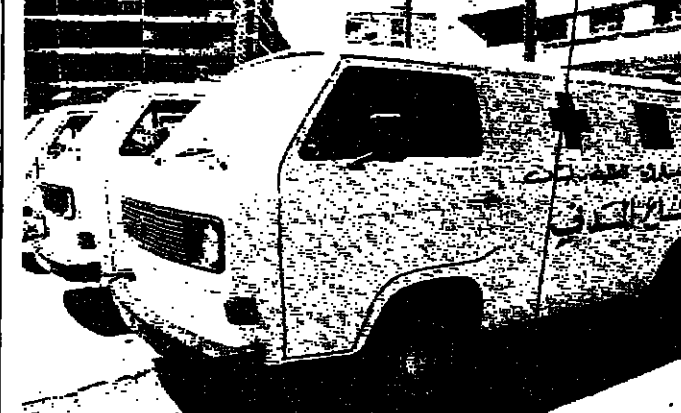
السيارات امام مقر الدفاع المدني